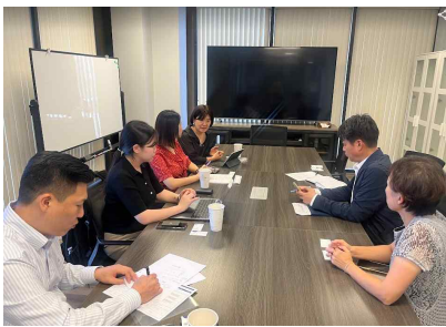
플러턴시 관계자 미팅