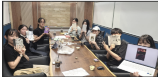
책 관련 활동 독서토론, 추천도서 선정 등