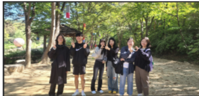
교류활동 워크숍, 전문교육 등