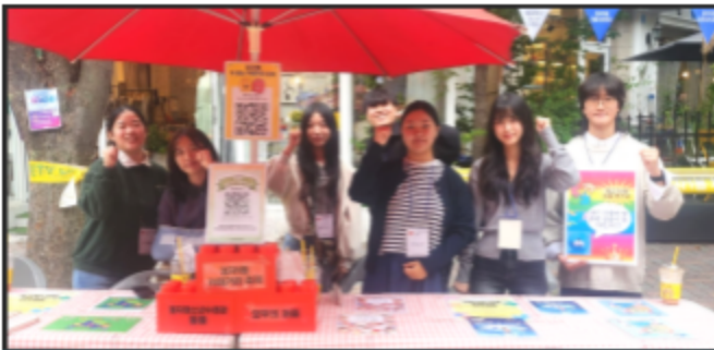
기획활동 축제부스 기획운영 등