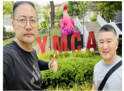
YMCA 기관 방문