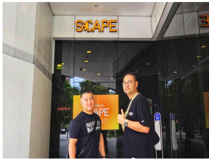
스케이프 허브 방문 (내부공사로 인해 주변탐방)